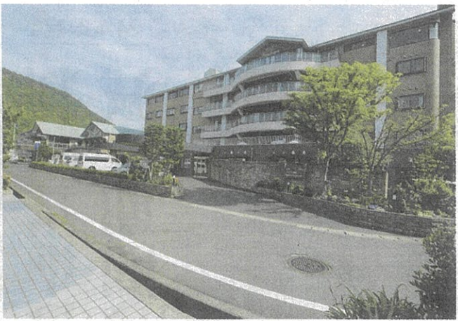
手前がケアハウス屋島。奥に併設のサ高住とサ高住がある