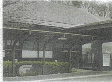
市の指定管理で温

て奥州市の指定管理を受け、温泉施設「前沢温泉舞鶴の湯」を始めた。誰でも利用できる健康増進施設であるとともに、介護予防事業として、事業対象者や要支援者で身体介護が不要な人を対象に、週3日、送迎付きのデイサービスを提供している。1つ200gの重りを自分に