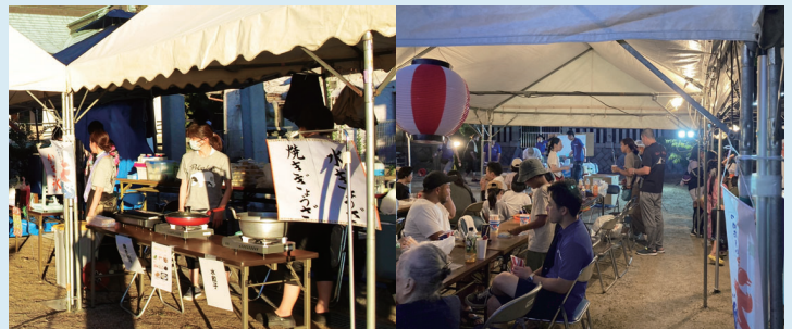
○4年ぶりに塩釜神社夏祭りに参加しました。