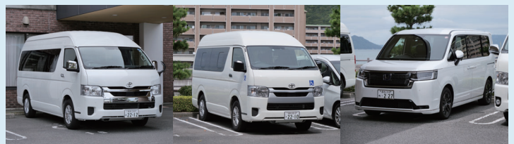
○車両入れ替えを行いました。